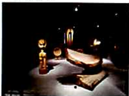
砂澤ビッキ彫刻作品