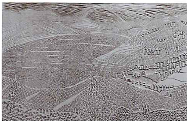
洞爺湖は星音符 (木画=板に描いた絵) 42.0cm×65.0cm