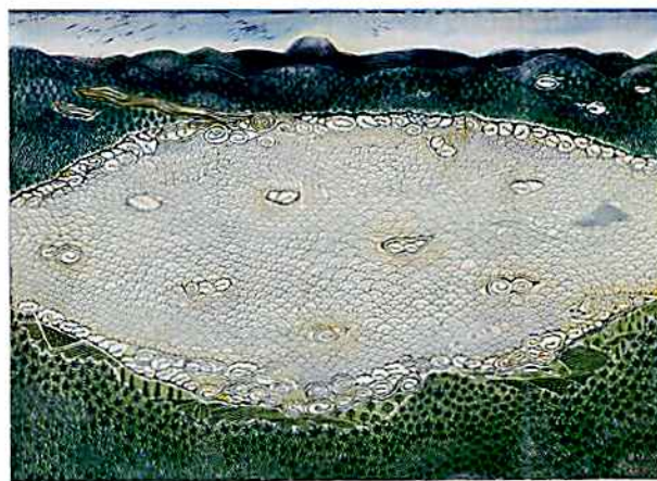
雲海のシンフォニー 春 60.0cm×80.0cm