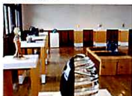
国際彫刻ビエンナーレ作品